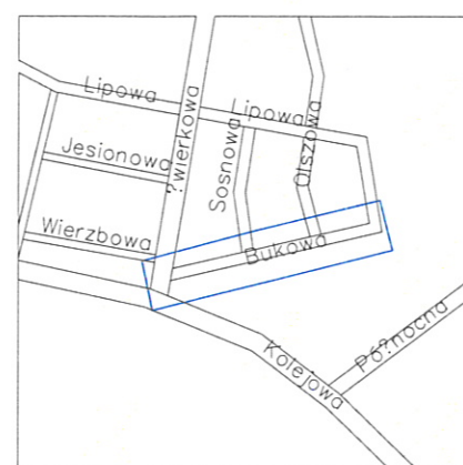
PLAN ORIENTACYJNY SKALA 1:10000

Zarząd Dróg i Zieleni w Suwałkach ul. Sejneńska 84, 16-400 Suwałki tel. (87) 566-78-55, 567-57-32 fax (87) 565-99-26 Reg. 200662077, NIP 844-23-49-608