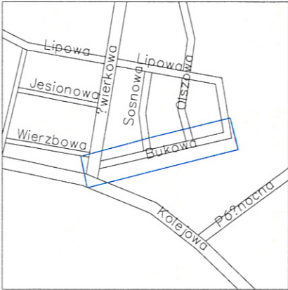
PLAN ORIENTACYJNY SKALA 1:10000