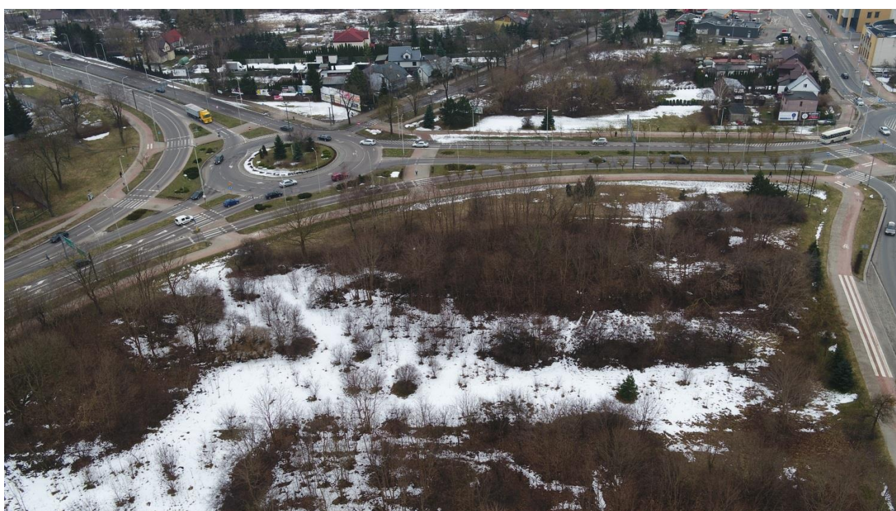
widok na kwartał od strony północnej w kierunku ul. Bulwarowej