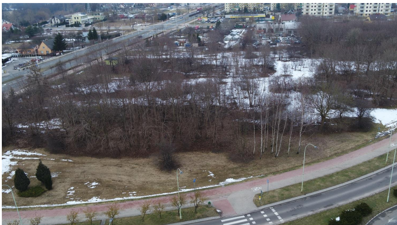
widok na kwartał od strony ul. Bulwarowej w kierunku ul. Północnej