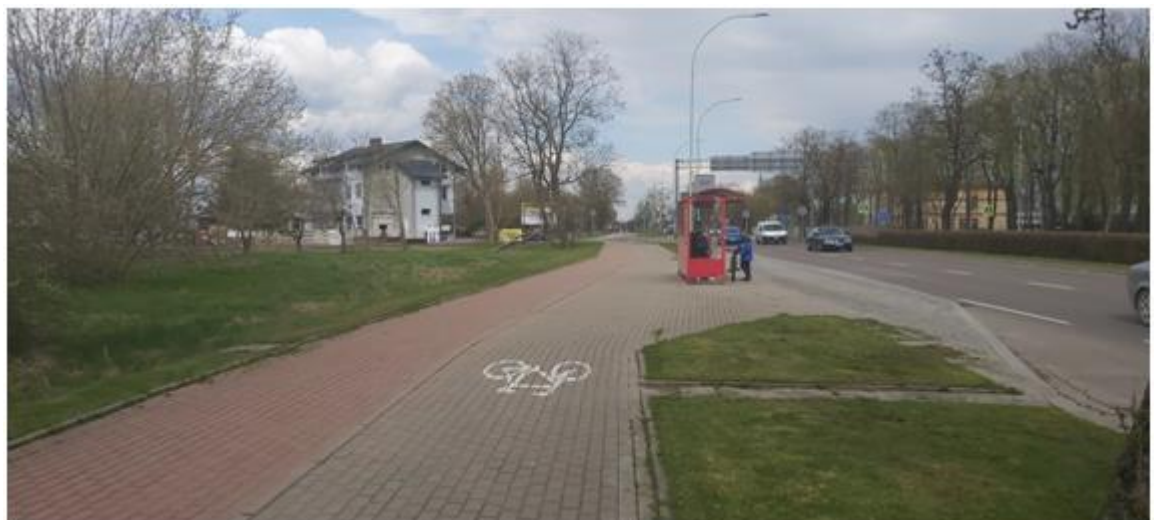
widok na przystanek i kwartał od strony ul. Pułaskiego w kierunku ul. Szczęsnowicza