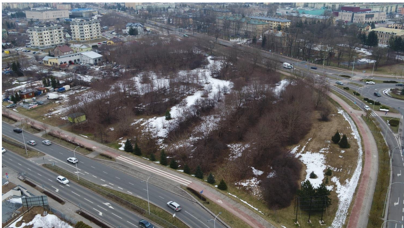
widok na kwartał od strony ul. Reja w kierunku ul. Pułaskiego