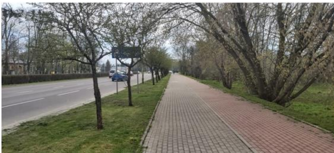
widok na kwartał od strony ul. Pułaskiego w kierunku ul. Bulwarowej