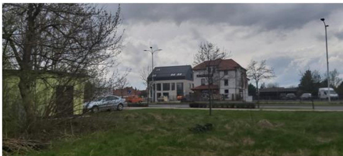
Widok na zabudowę po drugiej stronie ul. Reja