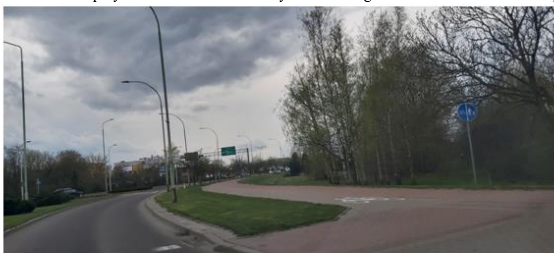
widok na kwartał od strony ul. Bulwarowej w kierunku ul. Reja