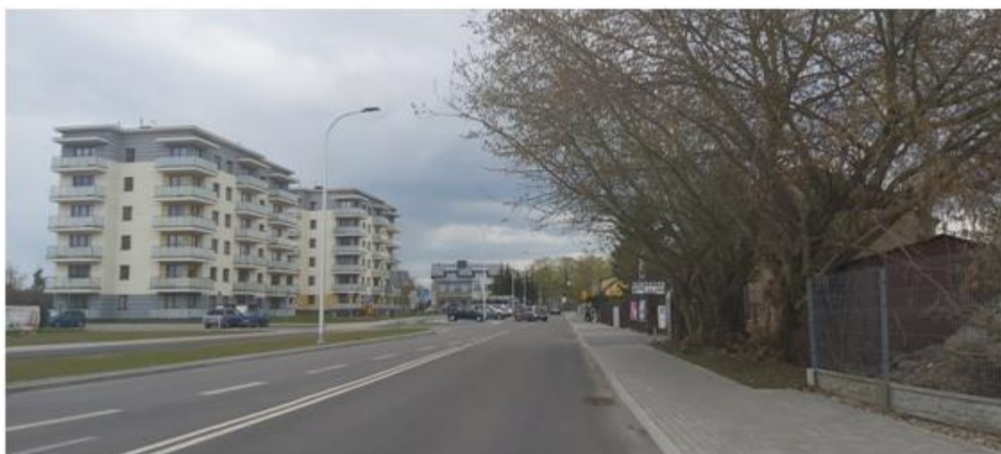
Widok na zabudowę po drugiej stronie ul. Szczęsnowicza