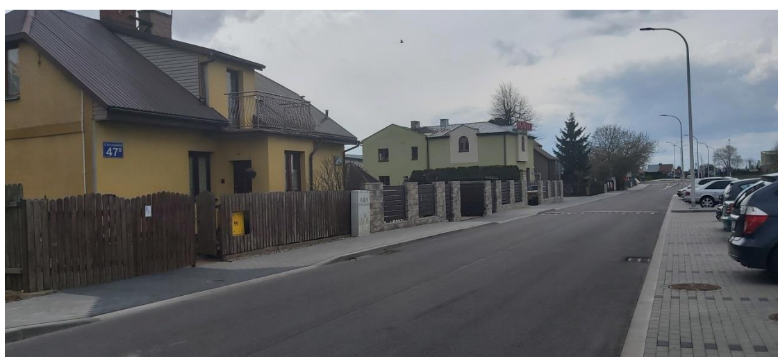
Widok na zabudowę przy ul. Szczęsnowicza strona południowa