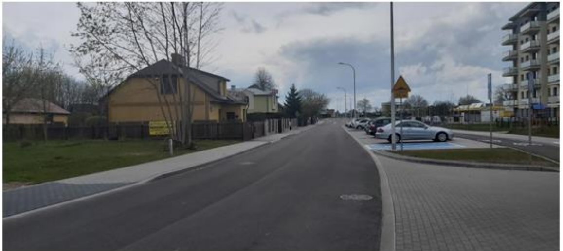
Widok na ul. Szczęsnowicza w kierunku ul. Reja