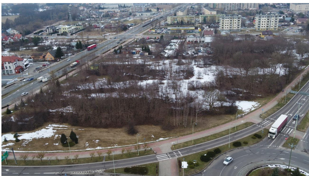
widok na kwartał od strony ul. Bulwarowej w kierunku ul. Północnej