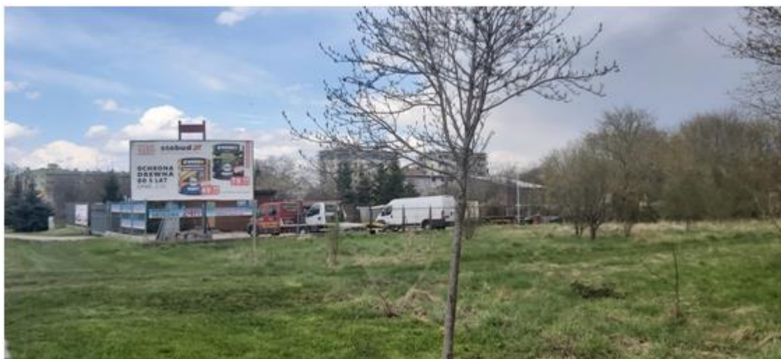
widok na istniejące zainwestowanie od strony ul. Reja w kierunku ul. Szczęsnowicza