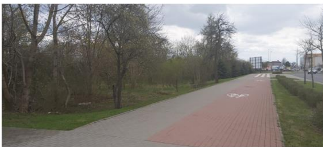
widok na kwartał od strony ul. Reja w kierunku ul. Bulwarowej