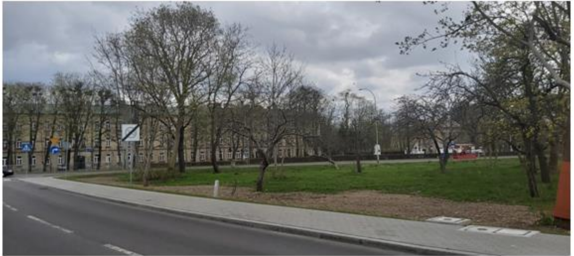
Widok na kwartał z ul. Szczęsnowicza w kierunku Pułaskiego i zabudowę po jej drugiej stronie