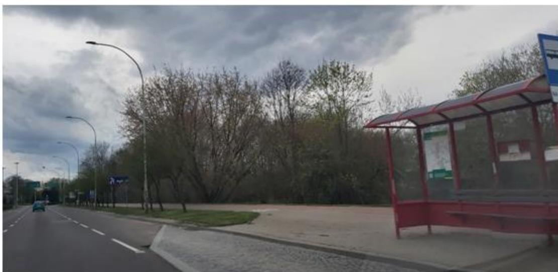
widok na przystanek i kwartał od strony ul. Pułaskiego w kierunku ul. Bulwarowej