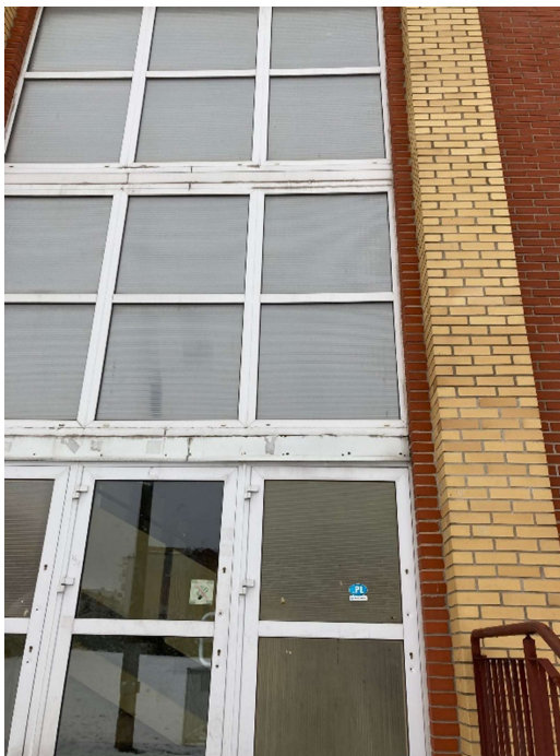
Fot. 2 – widok stolarki od zewnątrz (Okno istniejące O13 do wymiany – 1 szt., drzwi z nasświetlami bocznymi)

Drzwi aluminiowe z nasświetlami bocznymi, wyposażone w dwa zamki, samozamykacz, dwuskrzydłowe, całkowicie przeszklone, szklone szkłem bezpiecznym P4, światło przejścia dla całego skrzydła min. 120×200cm, światło przejścia skrzydła czynnego min. 90×200cm. Współczynnik przenikania ciepła dla drzwi aluminiowych U=1,3 \text{ W/m}^2 \cdot \text{K} .