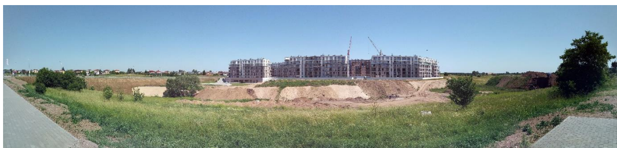
Fot.7 Panorama nowopowstającej Osiedla Sobola Biel od ulicy Sportowej (widoczne obniżenie terenu)