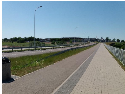
Fot 2. Ulica Aleksandry Piłsudskiej