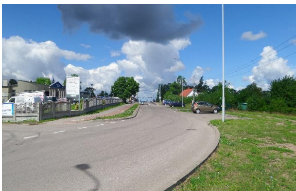
Fot. 1 Ulica Sportowa