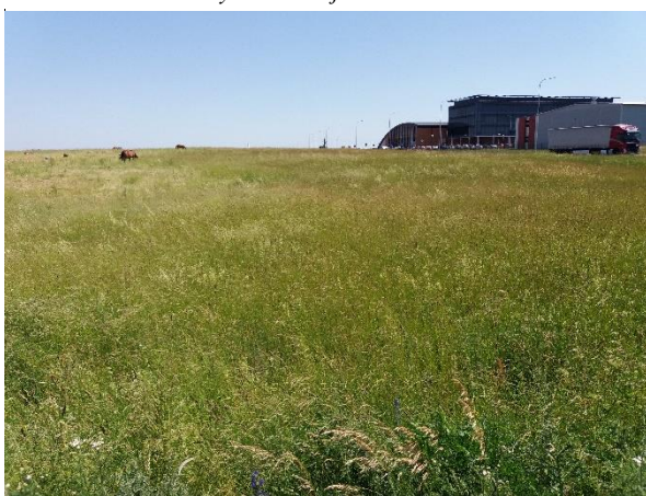
Fot.5 Niezabudowany teren przy ulicy Sportowej