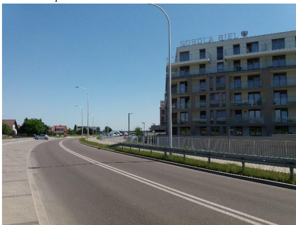
Fot. 3 Ulica Aleksandry Piłsudskiej i Osiedle Sobola Biel