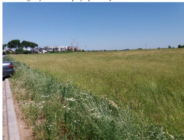
Fot. 6 Niezabudowany teren przy ulicy Sportowej