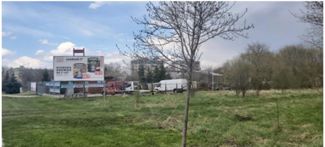
widok na istniejące zainwestowanie od strony ul. Reja w kierunku ul. Szczęsnowicza