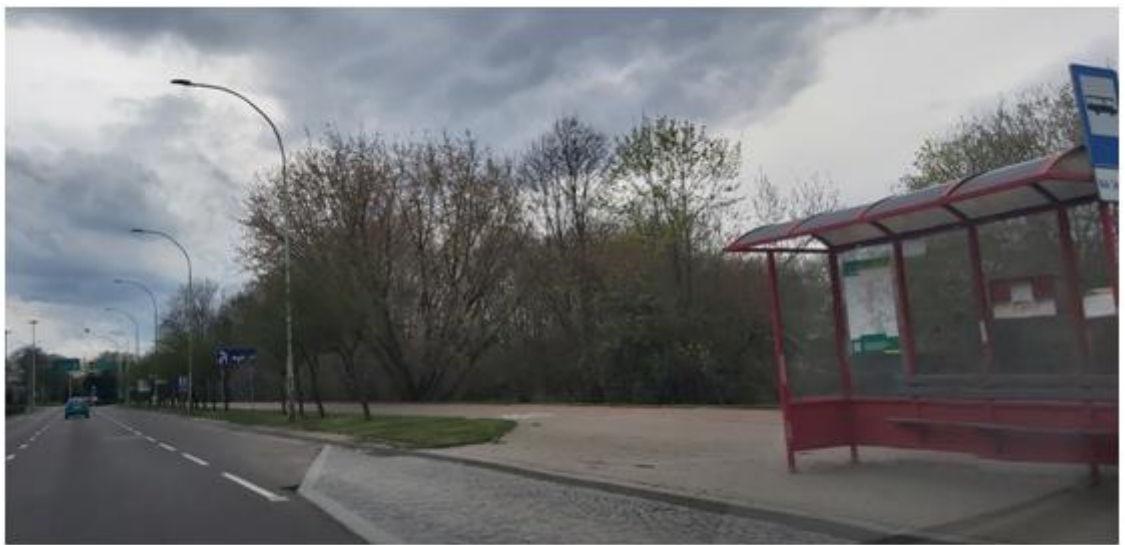
widok na przystanek i kwartał od strony ul. Pułaskiego w kierunku ul. Bulwarowej