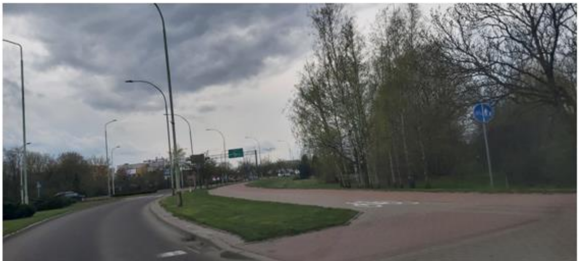
widok na kwartał od strony ul. Bulwarowej w kierunku ul. Reja