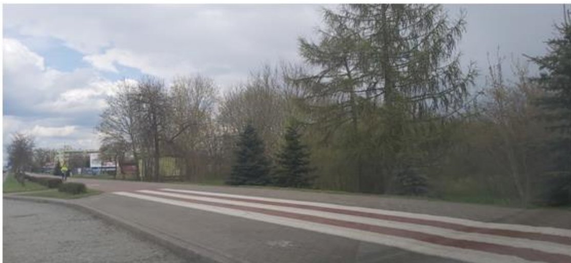
Widok na Kwartał z ul. Reja w kierunku ul. Szczęsnowicza