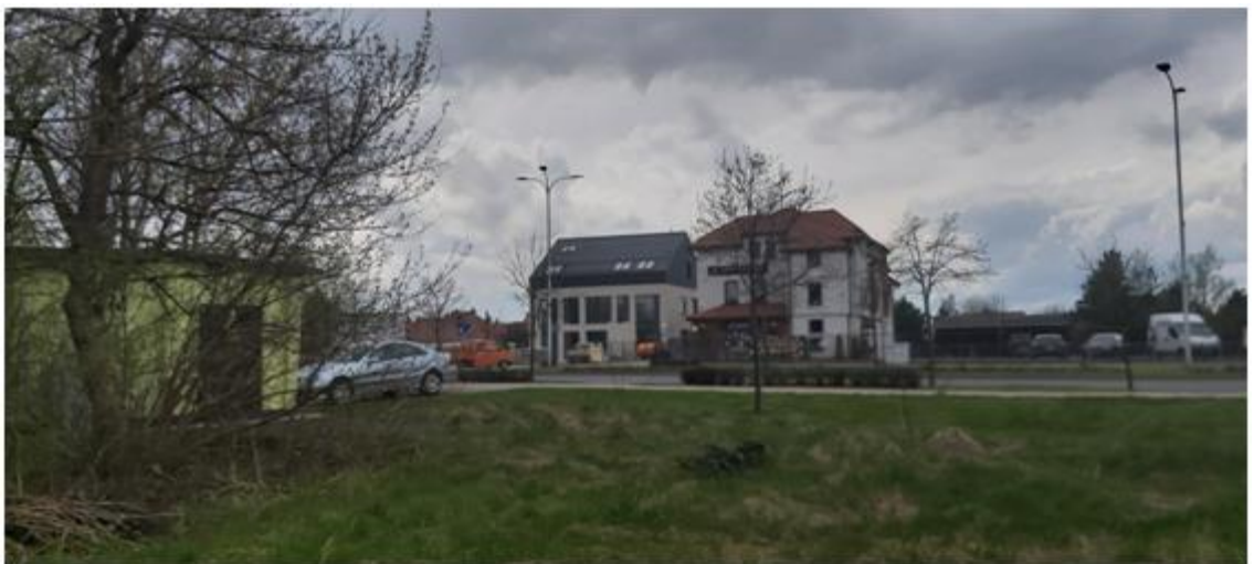
Widok na zabudowę po drugiej stronie ul. Reja