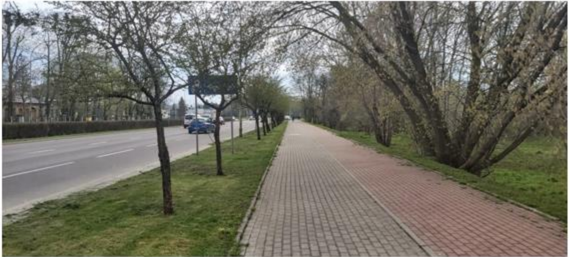
widok na kwartał od strony ul. Pułaskiego w kierunku ul. Bulwarowej