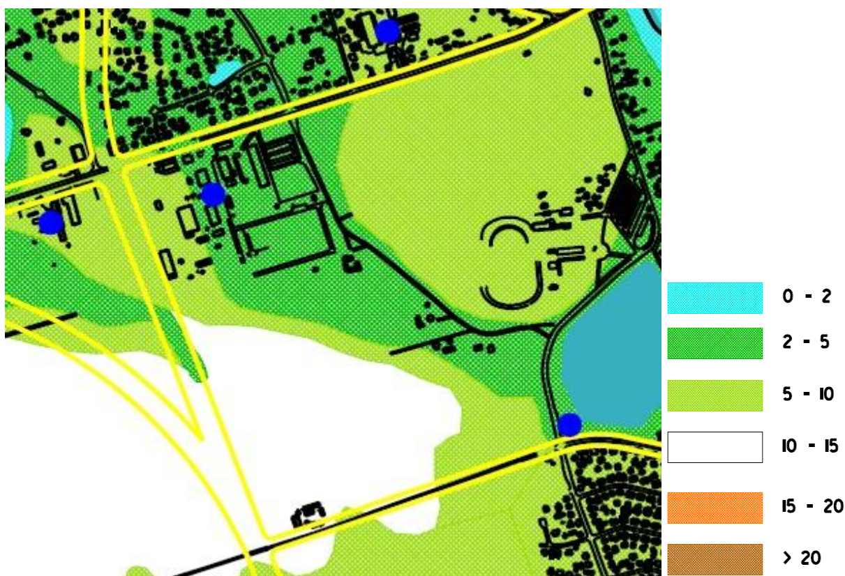
Mapa. 1. Wyciąg z Mapy Uwarunkowań Hydrologicznych (w legendzie podano głębokość do pierwszego zwierciadła wód podziemnych w m pod powierzchnią terenu)

Poziom wód podziemnych obrazuje wyciąg z ”Studium uwarunkowań ekofizjograficznych miasta Suwałki- 2004 r.”- autor Mirosław Tatarata- mapa Nr 1.