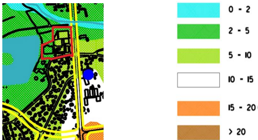
Mapa. 1. Wyciąg z Mapy Uwarunkowań Hydrologicznych (w legendzie podano głębokość do pierwszego zwierciadła wód podziemnych w m pod powierzchnią terenu)

Poziom wód podziemnych obrazuje wyciąg ze ”Studium uwarunkowań ekofizjograficznych miasta Suwałki- 2004 r.”- autor Mirosław Tatarata- mapa Nr 1.