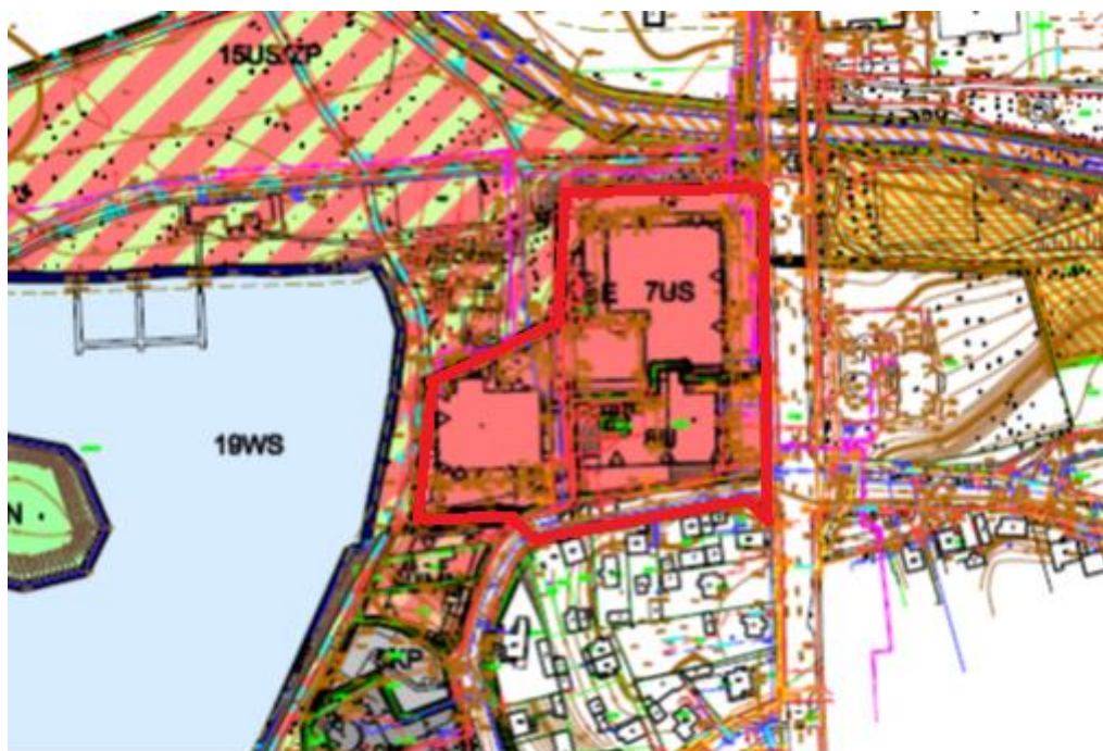
Rys. 1. Granice opracowania na tle części obowiązującego miejscowego planu zagospodarowania przestrzennego

Analizowany obszar znajduje się na terenie objętym zmianą miejscowego planu zagospodarowania przestrzennego terenów rekreacyjnych zalewu Arkadia i terenów wzdłuż rzeki Czarnej Hańczy w Suwałkach, przyjętą uchwałą XXXI/332/2013 Rady Miejskiej w Suwałkach z dnia 30 stycznia 2013 r. (Dz. Urz. Woj. Podlaskiego z dnia 26 lutego 2013 r., poz. 1285). Obejmuje obszary oznaczone w tym planie symbolami 7US, 8U, 20aE, 20bE i fragment drogi publicznej oznaczonej symbolem 2KD-L.