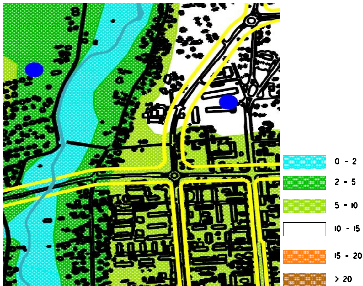
Mapa. 1. Wyciąg z Mapy Uwarunkowań Hydrologicznych (w legendzie podano głębokość do pierwszego zwierciadła wód podziemnych w m pod powierzchnią terenu)

Środowisko gruntowo- wodne, szczególnie wód podziemnych, narażone jest na zanieczyszczenie z powodu: