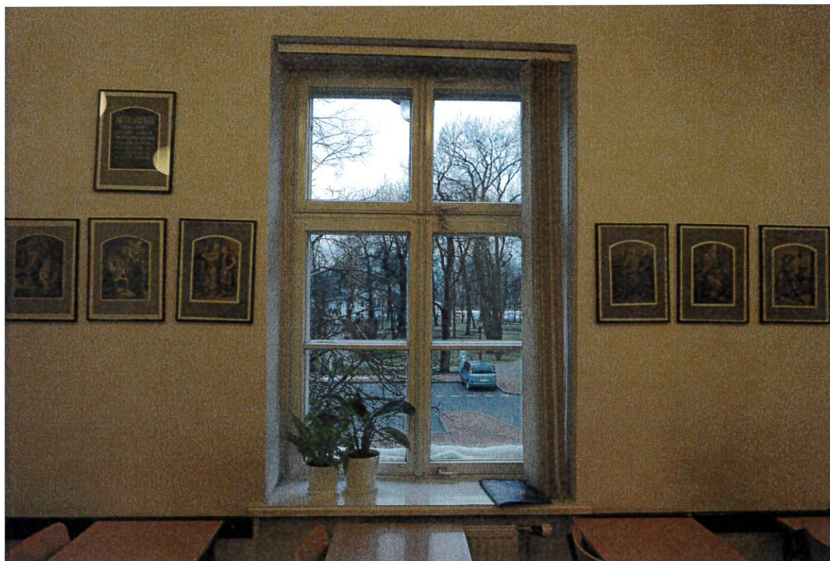
Fot nr 1 Okno O1 – piętro