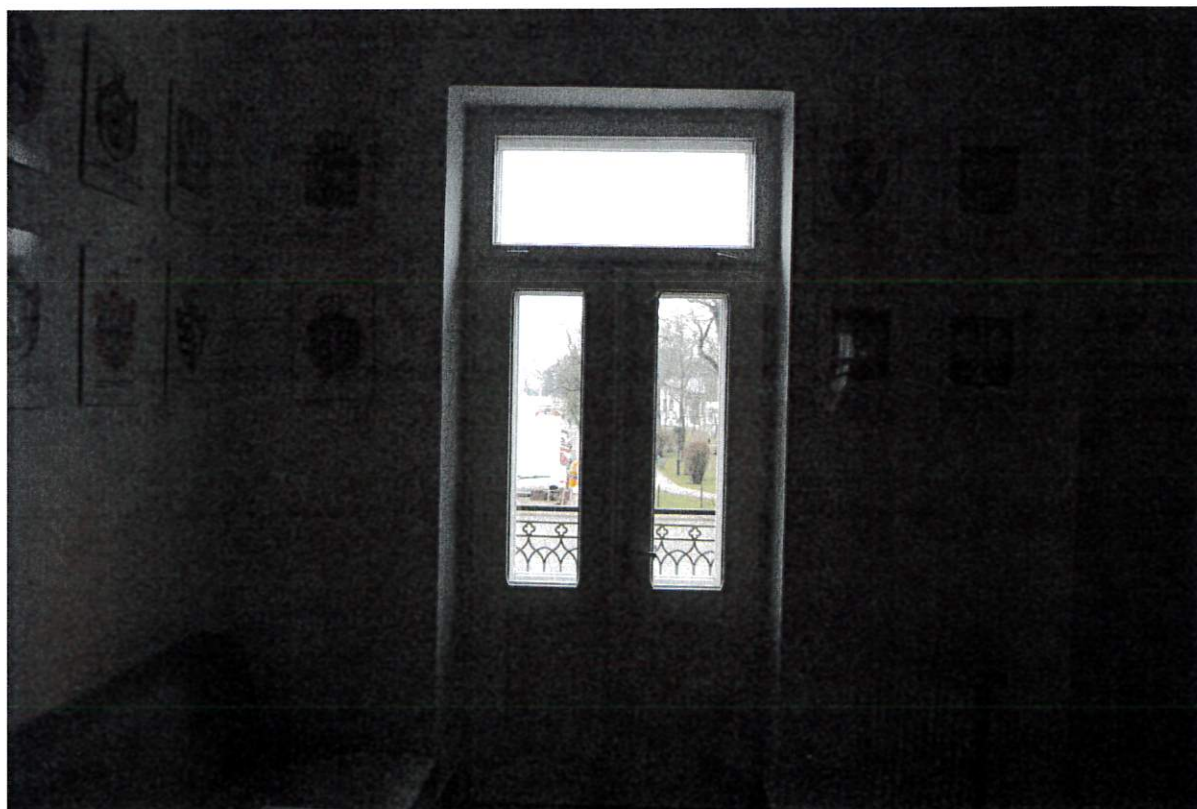
Fot nr 2 drzwi balkonowe D1