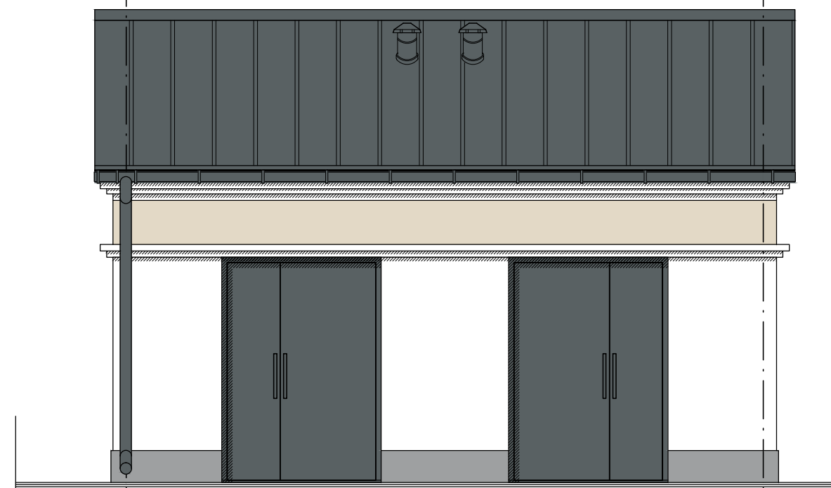
ELEWACJA FRONTOWA skala 1:50