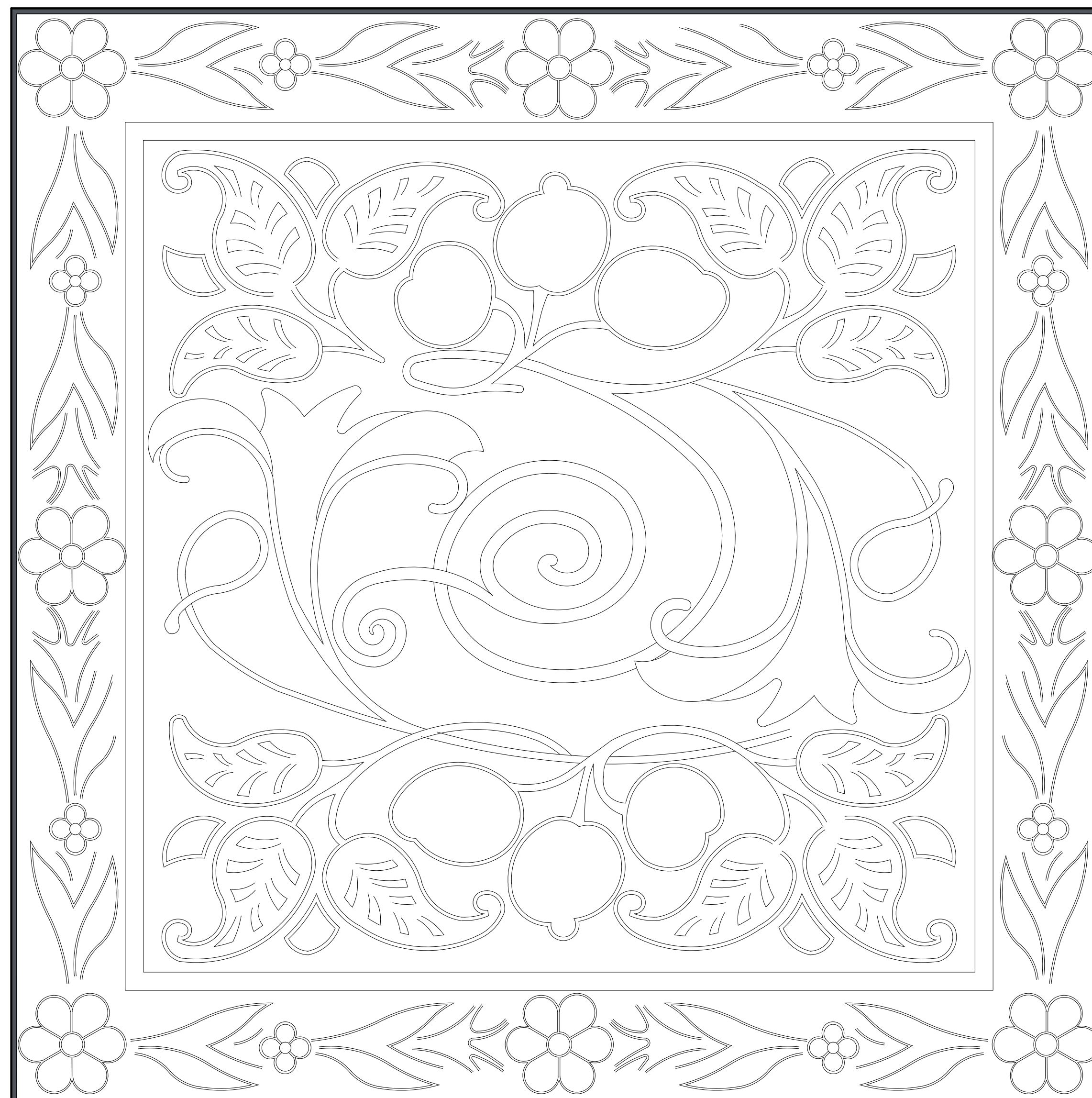
WZÓR ISTNIEJĄCEJ PŁYTKI BALKONOWEJ PRZEZNACZONEJ DO ODTWORZENIA SKALA 1:1