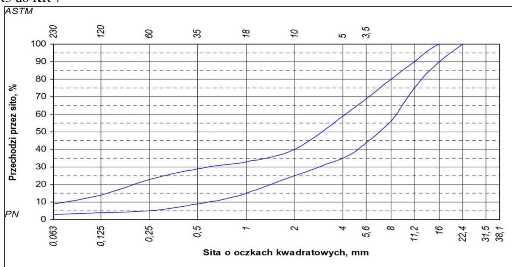
Rys.1. Krzywe graniczne uziarnienia mieszanki mineralnej BA 16 warstwy podbudowy nawierzchni drogi o obciążeniu ruchem od KR3 do KR 7

5.2. Skład mieszanki mineralno-asfaltowej powinien być ustalony na podstawie badań próbek wykonanych wg metody Marshalla. Próbkę powinny spełniać wymagania podane w tabelicy 3 lp. od 1 do 5. Wykonana warstwa podbudowy z betonu asfaltowego powinna spełniać wymagania podane w tabelicy 3 lp. od 6 do 8.