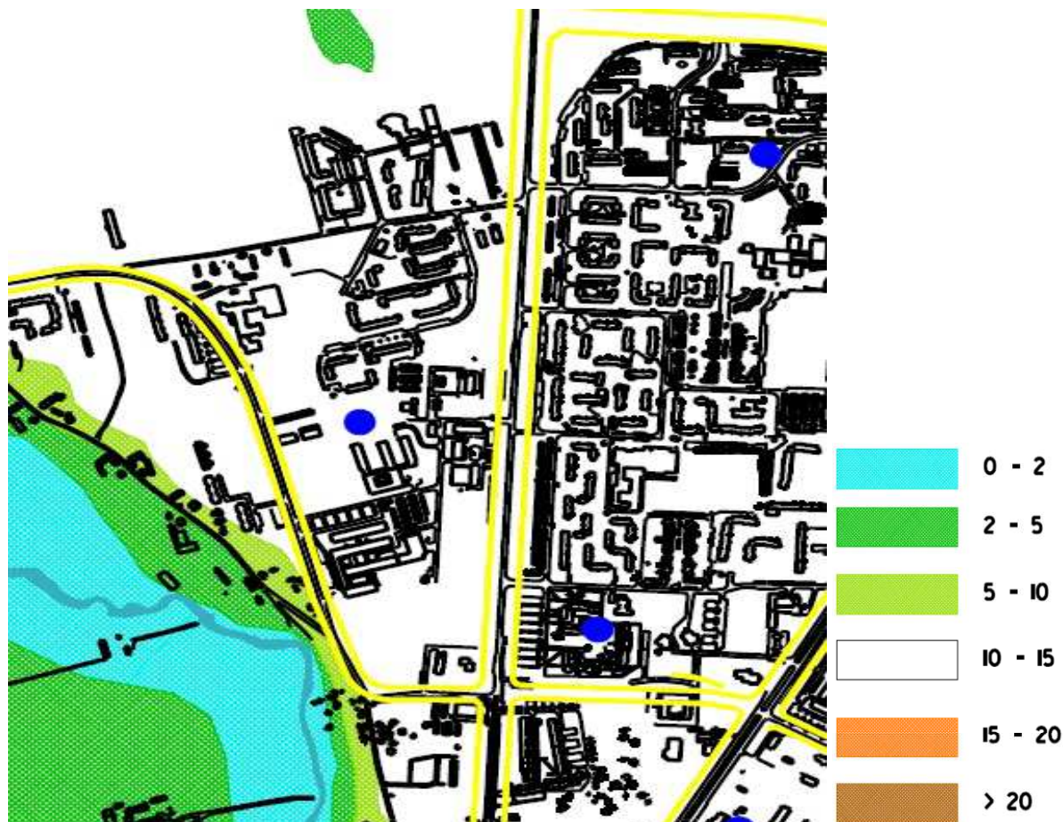
Mapa. 1. Wyciąg z Mapy Uwarunkowań Hydrologicznych (w legendzie podano głębokość do pierwszego zwierciadła wód podziemnych w m pod powierzchnią terenu)

Środowisko gruntowo- wodne, szczególnie wód podziemnych, narażone jest na zanieczyszczenie z powodu: