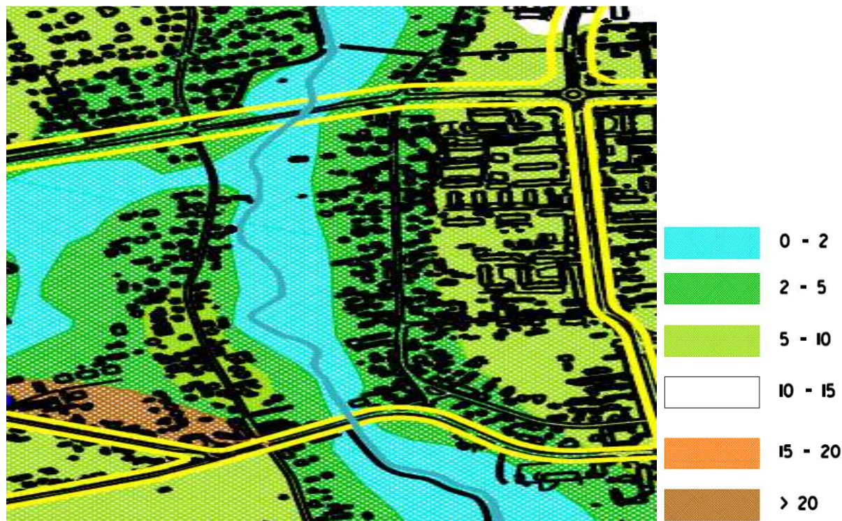
Mapa. 2. Wyciąg z Mapy Uwarunkowań Hydrologicznych (w legendzie podano głębokość do pierwszego zwierciadła wód podziemnych w m pod powierzchnią terenu)

Poziom wód podziemnych obrazuje wyciąg ze ”Studium uwarunkowań ekofizjograficznych miasta Suwałki- 2004 r.”- autor Mirosław Tatarata- mapa Nr 2.