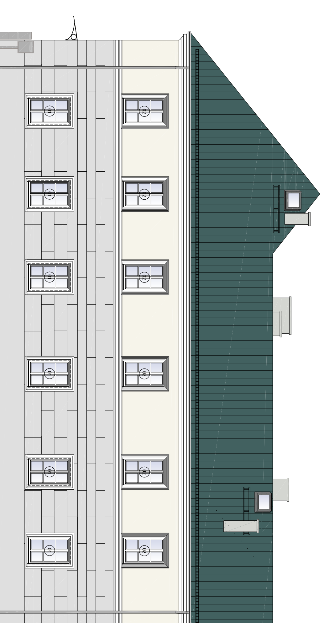
ELEWACJA PÓŁNOCNA SOK