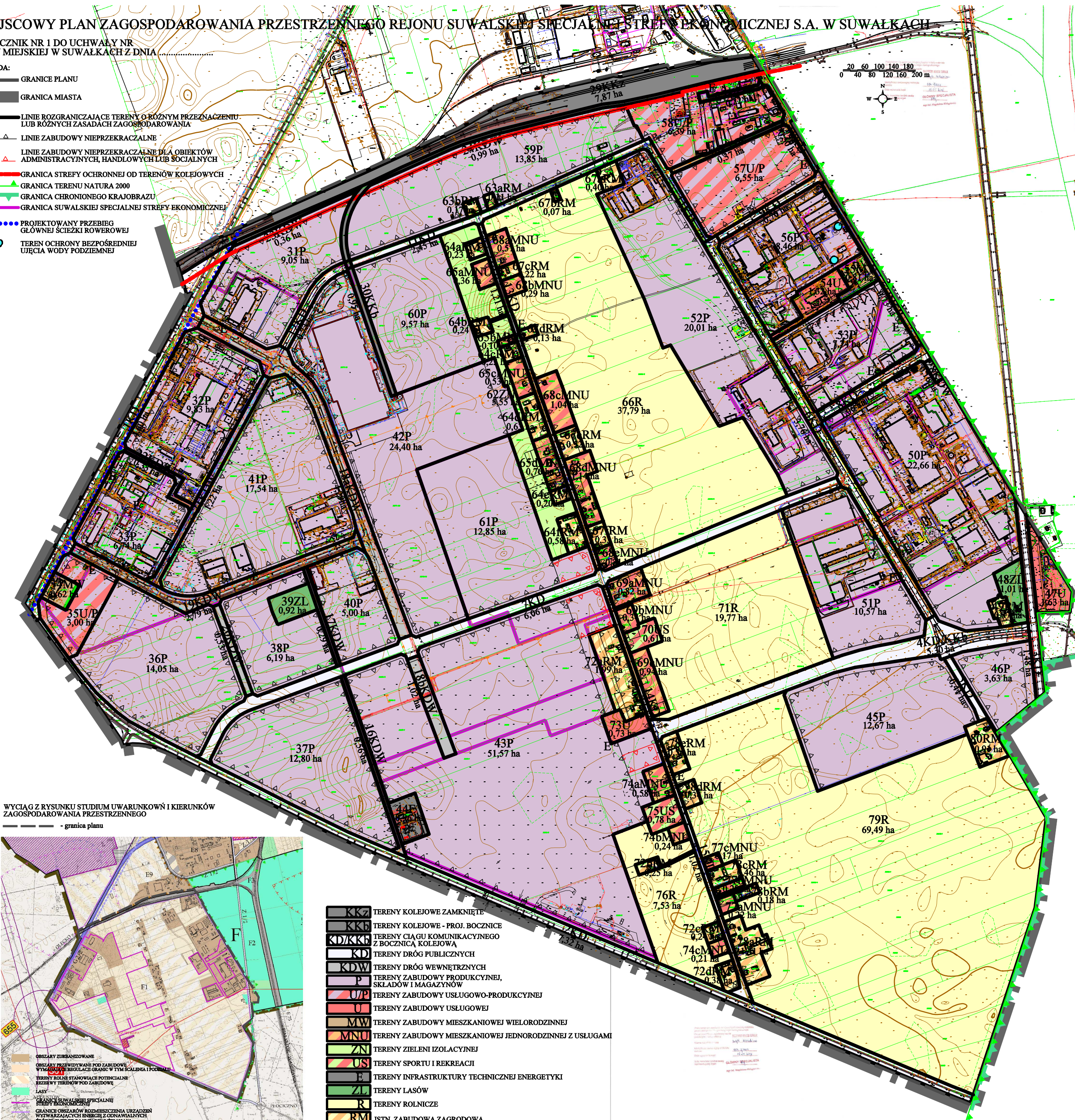
WYCIĄG Z RYSUNKU STUDIUM UWARUNKÓW I KIERUNKÓW ZAGOSPODAROWANIA PRZESTRZENNEGO