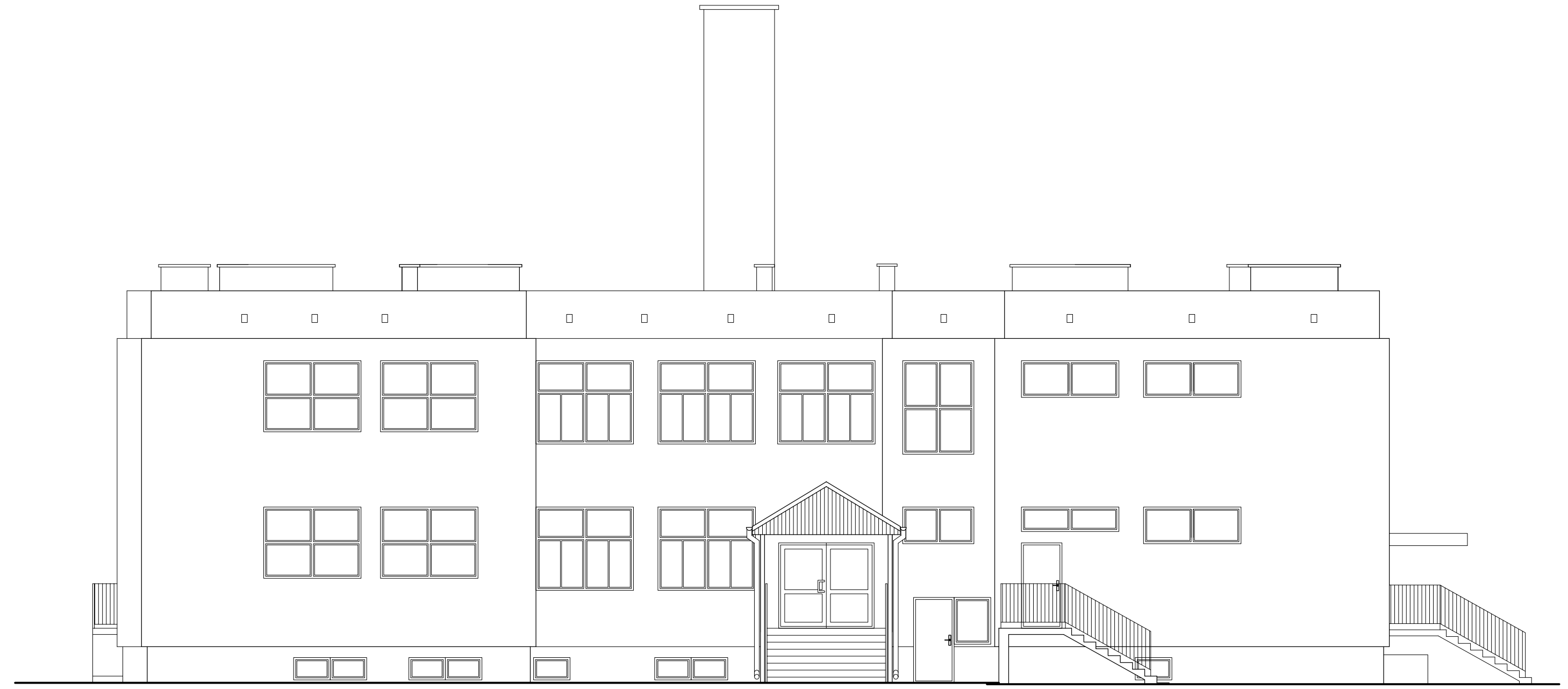
ELEWACJA PÓLNOCNO - ZACHODNIA