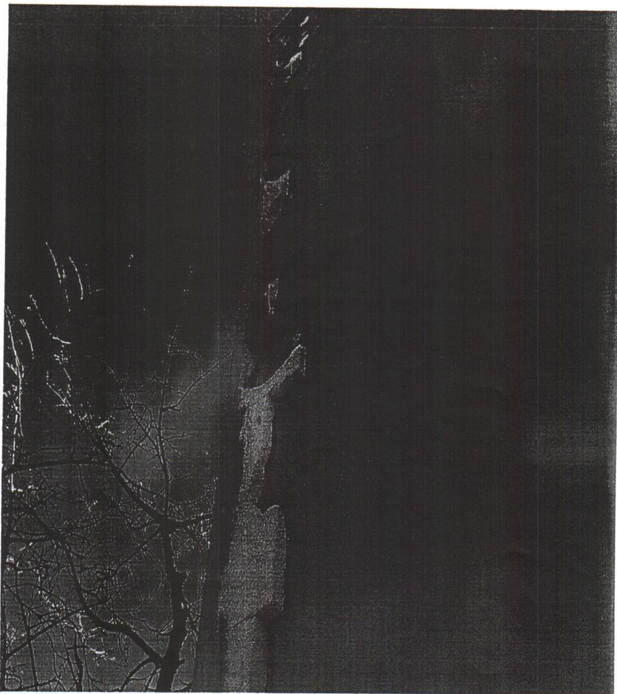
Fot. Nr 2 dewastowane boki ocieplenia budynku przez ptaki

Część wyższa budynku na trzech pozostałych ścianach ocieplona jest metodą ECSI/BSO styropianem gr 10 cm. Nie zakończone krawędzie elewacji na ścianie zachodniej są dewastowane przez ptactwo. Zasadne byłoby zakończenie robót związanych z ociepleniem. Koszt robót w załączeniu.